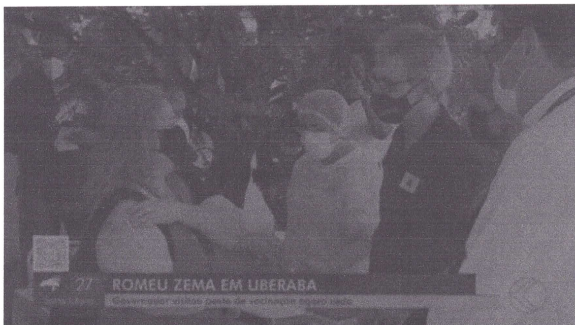
Governador Romeu Zema cumpre agenda em Uberaba nesta quinta-feira (17)

Às 15h, no Centro Administrativo da Prefeitura, Zema anuncia recursos destinados à área da saúde de Uberaba e região.