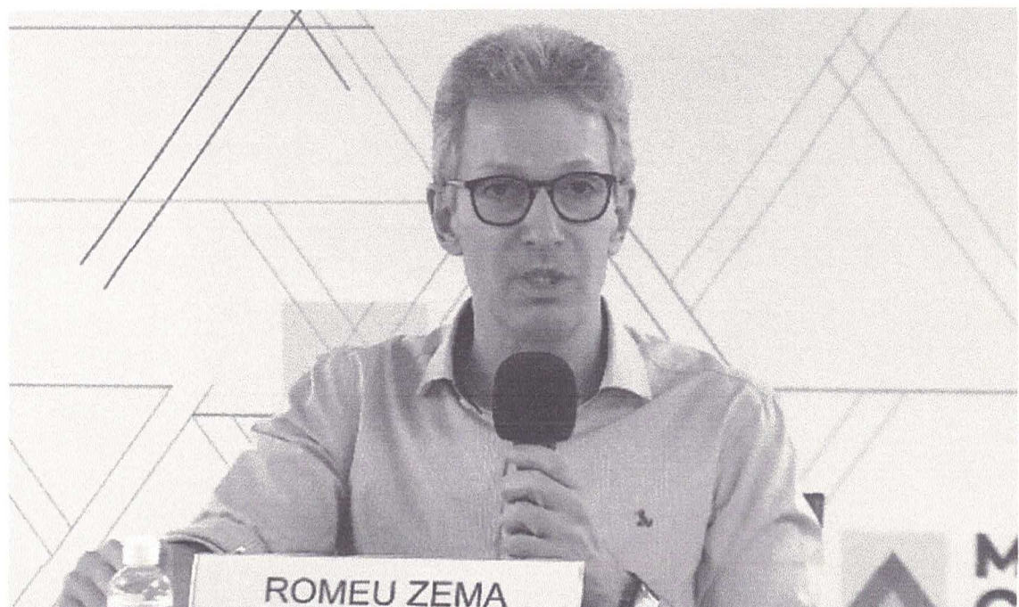
Romeu Zema em coletiva de imprensa

Nós usamos cookies e outras tecnologias semelhantes para melhorar a sua experiência em nossos serviços, personalizar publicidade e recomendar conteúdo de seu interesse. Ao utilizar nossos serviços, você concorda com tal monitoramento. Informamos ainda que atualizamos nossa Política de Privacidade . Conheça nosso Portal da Privacidade e veja a nossa nova Política.