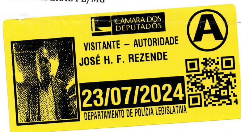
ZÉ VITOR DEPUTADO FEDERAL PL/MG