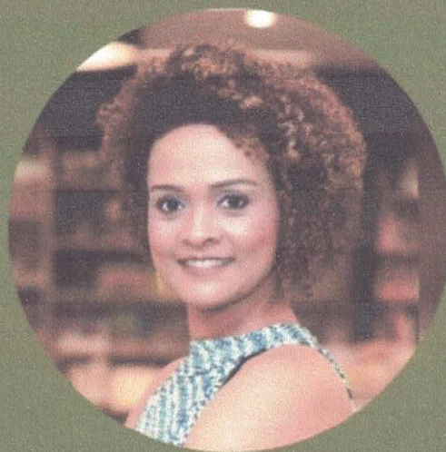
DRA. NÚBIA ADVOGADA

GARANTA JÁ SUA INSCRIÇÃO INVESTIMENTO: R$850,00