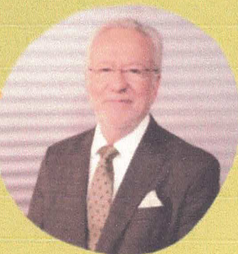
Palestrante Convidado - Alexandre Garcia - Jornalista