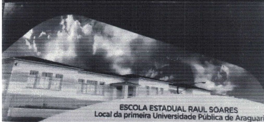
ESCOLA ESTADUAL RAUL SOARES Local da primeira Universidade Pública de Araguari

Local: Sicoob-Aracredi - Rua Major Joaquim Magalhães 303, Centro, Araguari/MG.