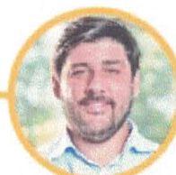
FERNANDO MARCATO Secretário de Estado de Infraestrutura