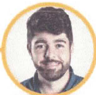
ZÉ VITOR Deputado Federal