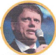
TARCÍSIO DE FREITAS Ministro da Infraestrutura